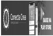
app-conectacrea-rodape (1).jpeg 31 KB

De : Joacyra Suzete Pereira - Jurídico <joacyra.pereira@lecard.com.br> Assunto : SOLICITAÇÃO DE ESCLARECIMENTOS CREA/PA - PE 008/2024 (VALE REFEIÇÃO) Para : licitacoes <licitacoes@creapa.com.br>