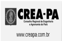
logocreaemail.png 6 KB