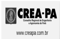
logocreaemail.png 6 KB