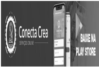
app-conectacrea-rodape (1).jpeg 31 KB