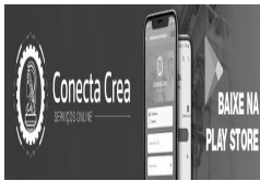
app-conectacrea-rodape.jpeg 31 KB