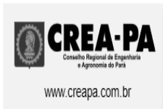
logocreaemail.png 6 KB